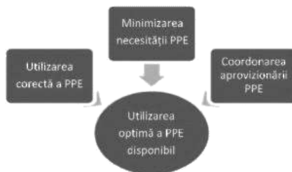
Fig. 1. Strategii de optimizare a disponibilității echipamentului individual de protecție (PPE)

Având în vedere deficitul global de echipament individual de protecție, următoarele strategii pot facilita utilizarea optimă a PPE (fig. 1).